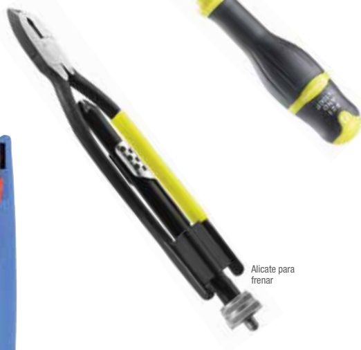
Alicate para frenar